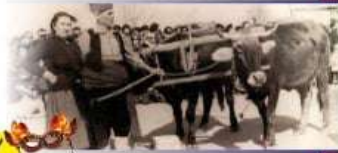
Κάθε χρόνο τις Αποκριές, ένα Τσίφνοιο «δραματίστη» «Μπέης», ή «Μπέης» και η «Μπέια» και η... «Μπέια» αναπαρά τον παραδοσιακό ένα ημερών ένα τα ατόνια του μούστου.