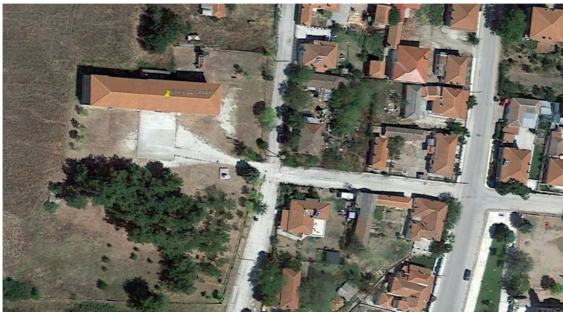
Εικόνα 2. Αεροφωτογραφία κτηρίου Ειδικού ΔΣ Θουρίου

Ο Δήμος Ορεστιάδας αποτελεί τον νόμιμο ιδιοκτήτη των κτιρίων και είναι υπεύθυνος για την κάλυψη του συνόλου του ενεργειακού κόστους, καθώς επίσης και για την συντήρηση των κτιριακών και μη εγκαταστάσεων. Μέσω της υλοποίησης των παρεμβάσεων ενεργειακής αναβάθμισης, ο Δήμος Ορεστιάδας στοχεύει στην βελτίωση των συνθηκών θερμικής άνεσης για τους χρήστες, οι οποίοι για το κτίριο του πρώην Δ.Σ. Καστανεών και σύμφωνα με την στοχοθέτηση της αλλαγής χρήσης αναμένεται να είναι μαθητές πρωτοβάθμιας και δευτεροβάθμιας εκπαίδευσης, ενώ για το Ειδικό Δημοτικό Σχολείο είναι παιδιά με αναπηρία (ΑμεΑ).