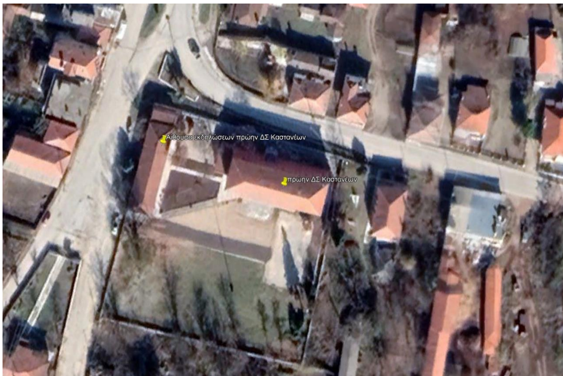
Εικόνα 1. Αεροφωτογραφία κτηρίου πρώην ΔΣ Καστανέων (google earth)

Η μελέτη εξετάζει βέλτιστη λύση εφαρμογής τεχνολογιών Α.Π.Ε. για την κάλυψη των θερμικών και ηλεκτρικών καταναλώσεων του κτηρίου σε συνδυασμό με τις παρεμβάσεις εξοικονόμησης ενέργειας στο κέλυφος και στα συστήματα. Στις παρακάτω εικόνες δίνονται αεροφωτογραφίες των κτηρίων που αναβαθμίζονται ενεργειακά.